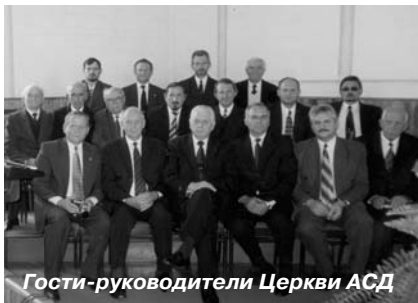
Гости-руководители Церкви АСД