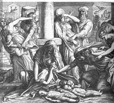
Избиение младенцев в Вифлееме (гравюра Юлиуса Шнорр фон Карольсфельда)

Еще одно событие, описанное в Библии, а именно избиение младенцев, получило научное подтверждение