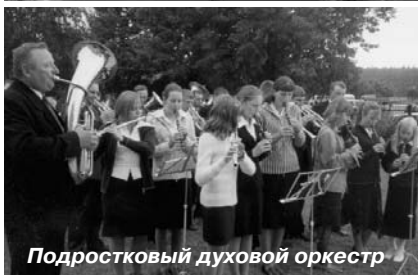
Подростковый духовой оркестр