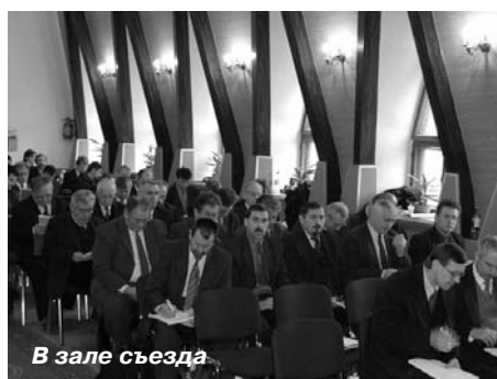
В зале съезда