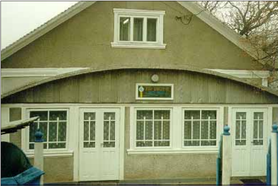
Молитовний будинок, с. Клішківці