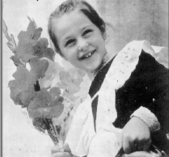
«Хто любить навчатися, той любить пізнання» Прп. Соломона 12,1

Ці липневі дні відзначала надзвичайна спека. Повітря неначе зависло в просторі, лише рідкий вітерець з віддалених Карпат доносив пахощі цілющих трав та стиглих яблук. А в просторому залі центральної чернівецької громади було бадьоро й приязно. Тут з радістю зу-