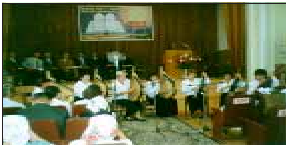
Ансамбль бандуристок «Буковинська перлина»