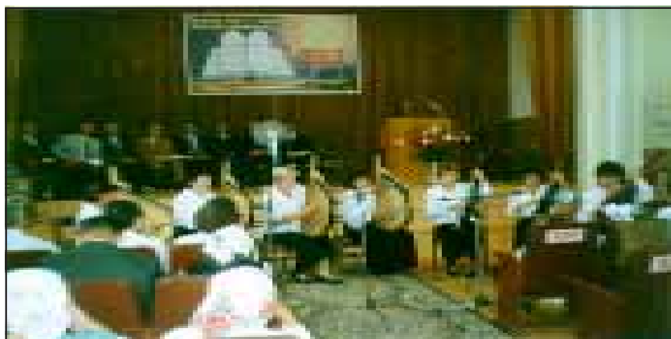
Ансамбль бандуристок «Буковинська перлина»