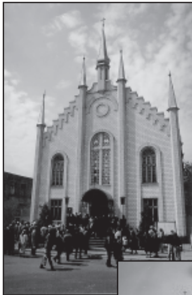
Молитвенный будинок по вул. Ямській, 70

В стадии регистрации находится Украинский гуманитарный институт в Лесной Буче. И это очень важно, что в рамках наших образовательных программ наряду с обучением пасторов мы имеем институт, который позволит обучать другим профессиям, например, менеджменту, управлению финансами.