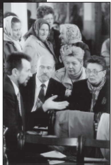
Урок Суботньої школи

ловит Церковь Свою в Украине. Я уверен в этом и буду молиться об этом.