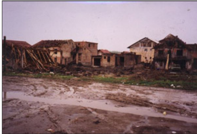
Разрушенные дома в городе Новый Сад, Косово.

В текущем кризисе Церковь адвентистов седьмого дня считает своим долгом сделать все возможное посредством Адвентистской службы развития и помощи (АДРА — гуманитарная служба,