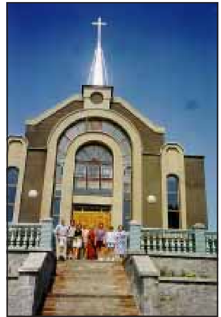
Молитовний будинок у м. Умані.