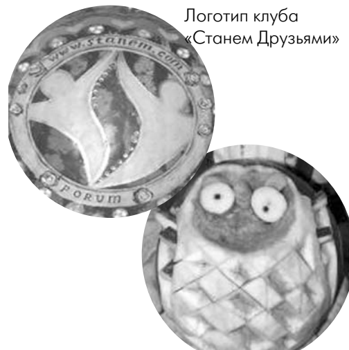
Логотип клуба «Станем Друзьями»