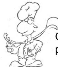
рис. Сильченко А.