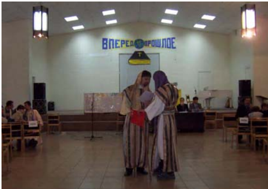
Совещание Моисея и Аарона

"Судьи сели и раскрылись книги..." (Дан. 7:10) - так начался конкурс, который вошел в историю как "Вперед в прошлое". Этот конкурс состоял из двух частей. В первой части все пришельцы и странники, вышедшие из Египта, распределялись по коленам, во главе