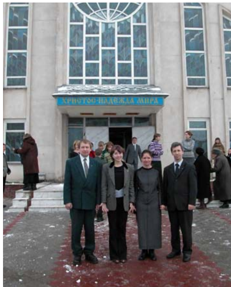
Делегаты конгресса от "Восточной" общины (неполный состав)

В первый же день всё началось с представления присутствующих объединений, в число которых входили: