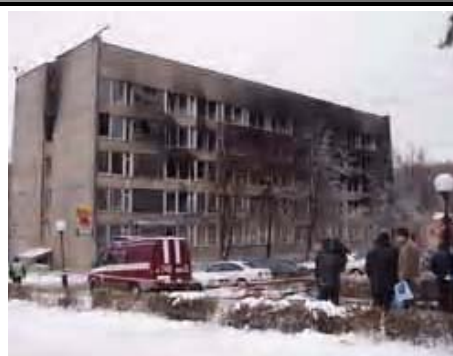
Пожар в общежитии университета Дружбы народов

Торжественное собрание открыл президент Заокского