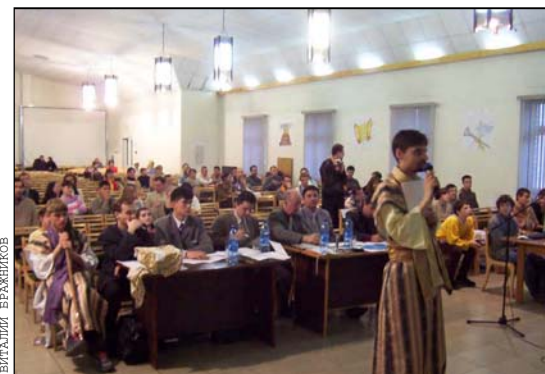
Авторитетные судьи стана Израильского

А.В.: В этом году было внесено много изменений в программу, и это, естественно, потребовало немало времени. Подготовка проходила около двух месяцев. Большой плюс был в том, что сразу же нашлись люди, готовые заняться этим, помочь. Руководители молодежи и активные члены церкви (в основном Москворецкой общины), очень активно взялись за это. В здании Восточной церкви даже на время открылся "цех по пошиву одежды" :)