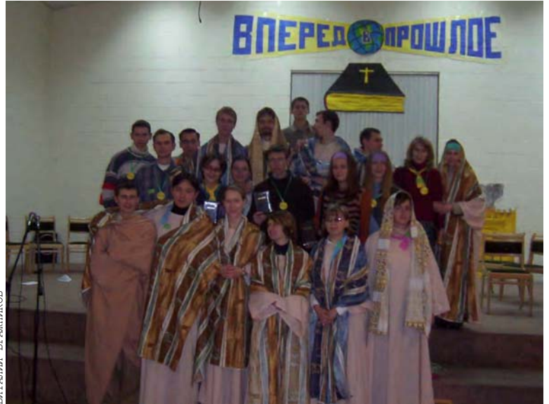
Победители конкурса “Вперед в прошлое” с наградами и левиты.