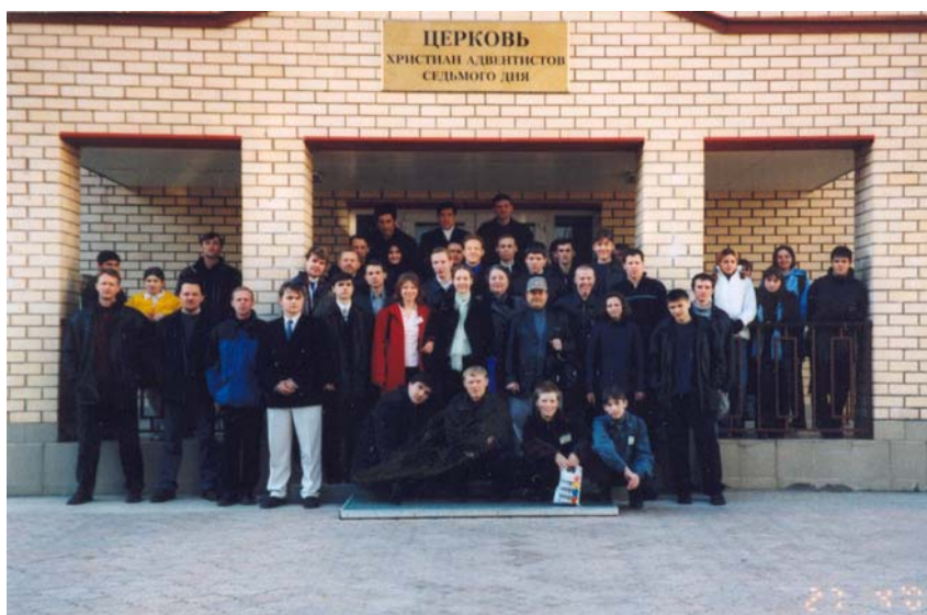
Делегаты молодежного форума «Планета Москва»

Во всем можно найти что-то хорошее, главное – не сдаваться!