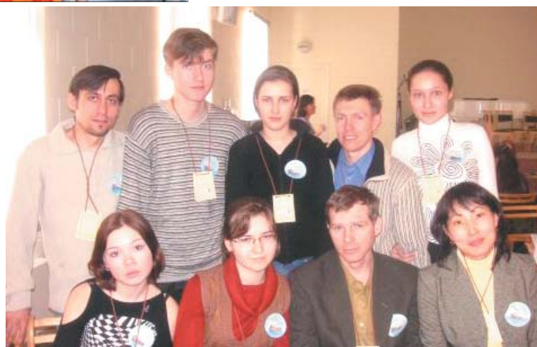
Представители о. «Восточная» (небольшая часть)

Итак, викторина началась. Первые два конкурса прошли как разминка для команд. Далее,