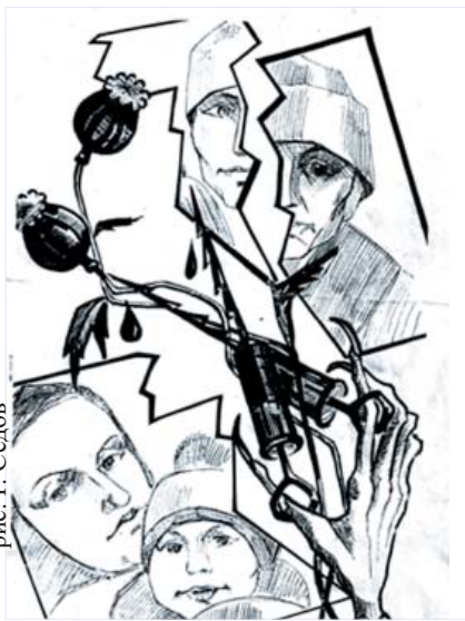
рис. Р. Седов

Бывало, мы с Женей не понимали друг друга в каких-то мелочах и конфликтовали, в такие минуты мне особо хотелось бросить все и «расслабиться разок» в тумане наркотиков, но я тут же спохватывался, понимая, к чему это приведет. Я говорил: «отойди от меня сатана!» И молился, чтобы Господь дал мне сил и терпения. Тогда, вспомнив об обещании, данном Богу в первой моей молитве, найти Валеру и заняться изучением Библии, я так и сделал, но не рассчитал своих сил. Боялся, что об этом узнают знакомые и будут косо смотреть и смеяться. И мои амбиции не позволили мне долго посещать церковь. Я постепенно бросил это дело, решив, что дома смогу иногда листать Священное Писание. Но тут я обманул: дома суета, телевизор, от которого не отлипнешь, хлопоты с пленками, работа и желание оторваться от этого где-то с друзьями. Порой я задумывался над происходящим, что я скатываюсь вниз, что мы отдаляемся с женой друг от друга, огорчая ребенка скандалами, - я начал курить траву и уже привязался к ней. Именно в такие моменты размышлений над жизнью, когда я понимал, что пора бросить все мирское и